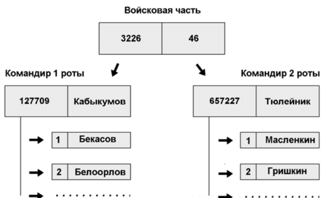
Рис. 1.2. Иерархическая база данных

Реальная иерархическая база данных войсковой части может выглядеть, к примеру, так, как показано на рис. 1.2.