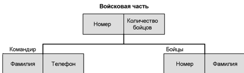
Рис. 1.1. Схема организации иерархической базы данных на примере войсковой части

Первыми базами данных были иерархические. Иерархическая база данных основана на древовидной структуре хранения информации и в этом смысле напоминает файловую систему компьютера. Наиболее известным и распространенным примером иерархической базы данных является Information Management System (IMS) фирмы IBM, первая версия которой появилась в 1968 г. С точки зрения организации хранения информации иерархическая база данных состоит из упорядоченного набора деревьев одного типа, т. е. каждая запись в базе данных реализована виде отношений "предок-потомок". На рис. 1.1 показана схема организации такой иерархической базы данных.